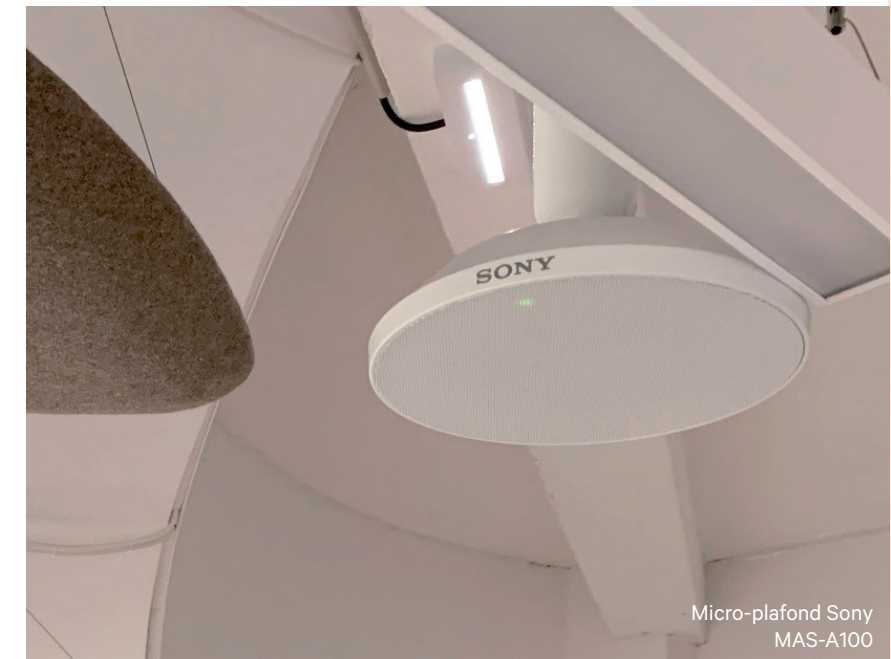
Micro-plafond Sony MAS-A100

Avec TEOS Book, vous pouvez vérifier la disponibilité des salles de réunion, les réserver depuis une application sur téléphone ou ordinateur, ou depuis une tablette