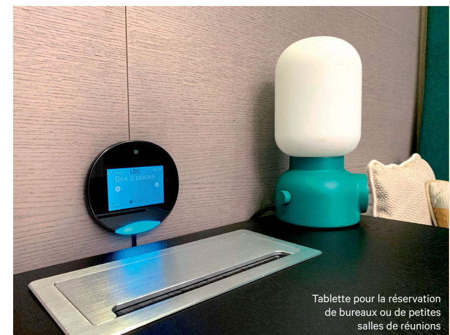
Tablette pour la réservation de bureaux ou de petites salles de réunions